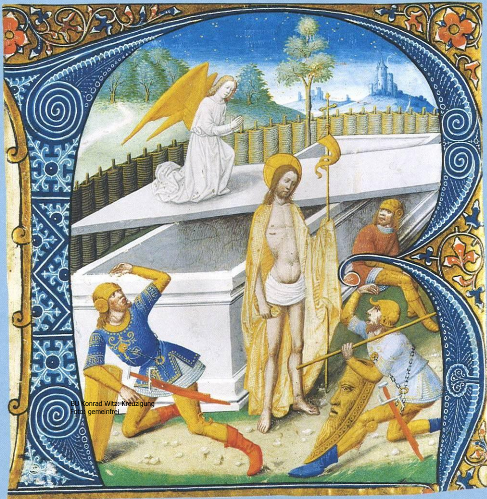
BU Konrad Witz: Kreuzigung Paris, gemeinfrei

Jacques de Besançon, Blatt aus einem Graduale: Buchstabe R mit einer Darstellung der Auferstehung, 15. Jahrhundert, Musée de Cluny Nationalmuseum des Mittelalters, Paris, © bpk – Bildagentur für Kunst, Kultur und Geschichte/RMN, Foto: Gérard Blot